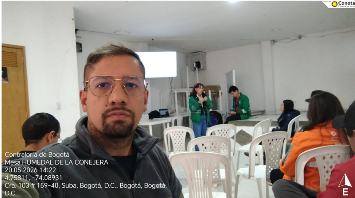
Imagen 2. Evidencia fotográfica de asistencia