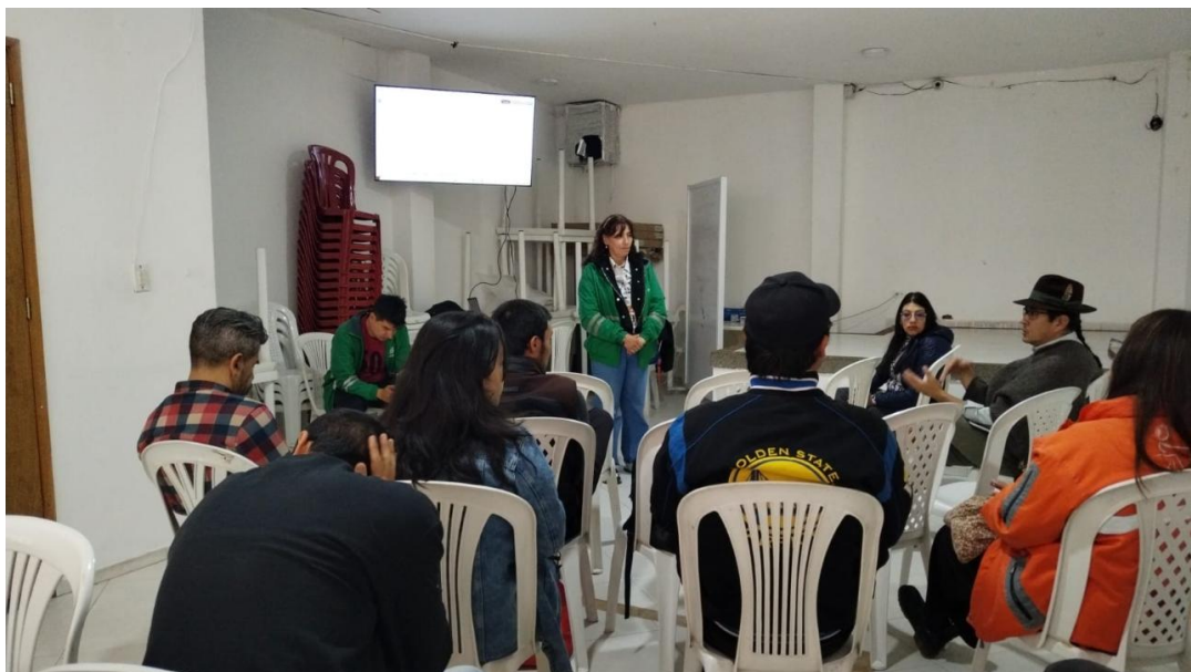
Imagen 1. Sesión de la Mesa Territorial Humedal La Conejera , Salón Comunal barrio Villa del Campo